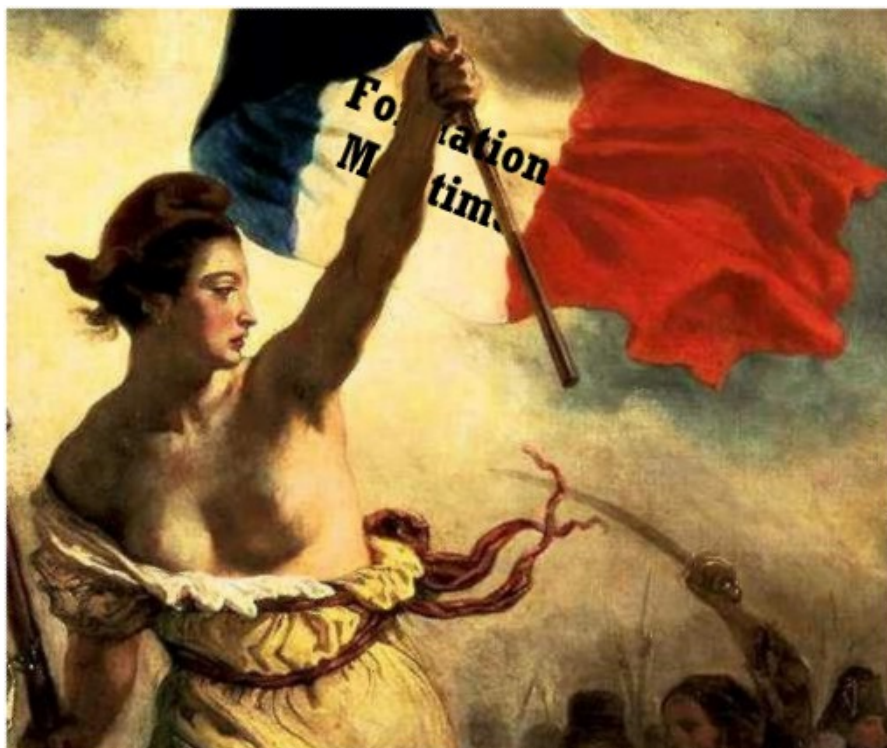
La Liberté guidant le peuple, d'Eugène Delacroix, revue et corrigée.