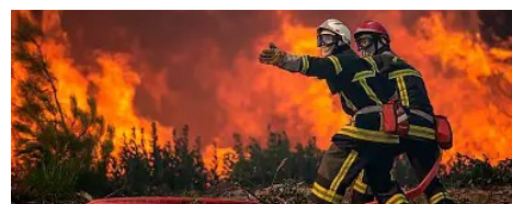
Austérité + hypocrisie = volontaires refusés