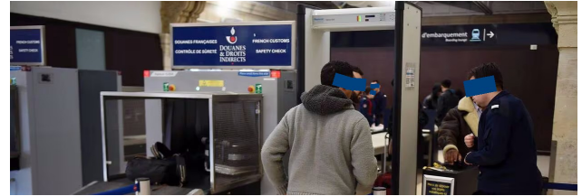
Soon an archive image?

The axe fell soon after the Projet de loi douanes (Customs bill) was passed on June 22: the privatization of the railway security is officially announced . This mission which is being carried out by the French customs will be transferred to a private security company.