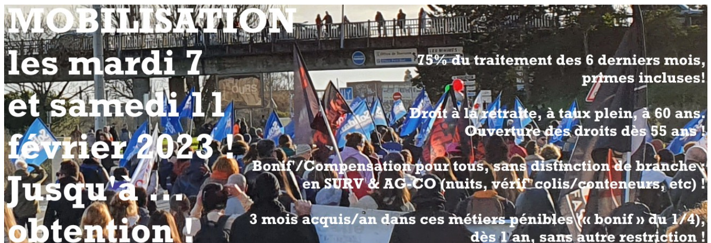
Cortège SOLIDAIRES à La Rochelle, mobilisation du 31 janvier 2023