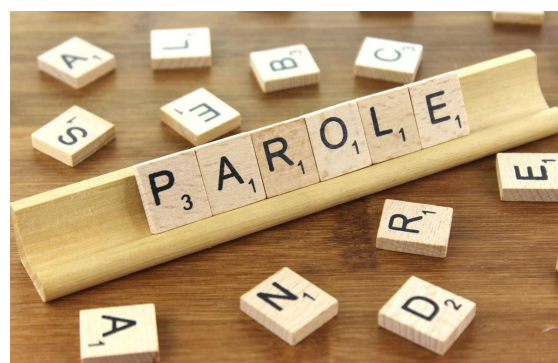
Zéro langue de bois ?!

Le mouvement au Centre de services des ressources humaines (CSRH, cf notre communiqué du 6 mai) se poursuit ! Le préavis de grève déposé pour la journée du 16 mai a été suivi par 81 % des agents, c'est dire si la coupe déborde au CSRH !