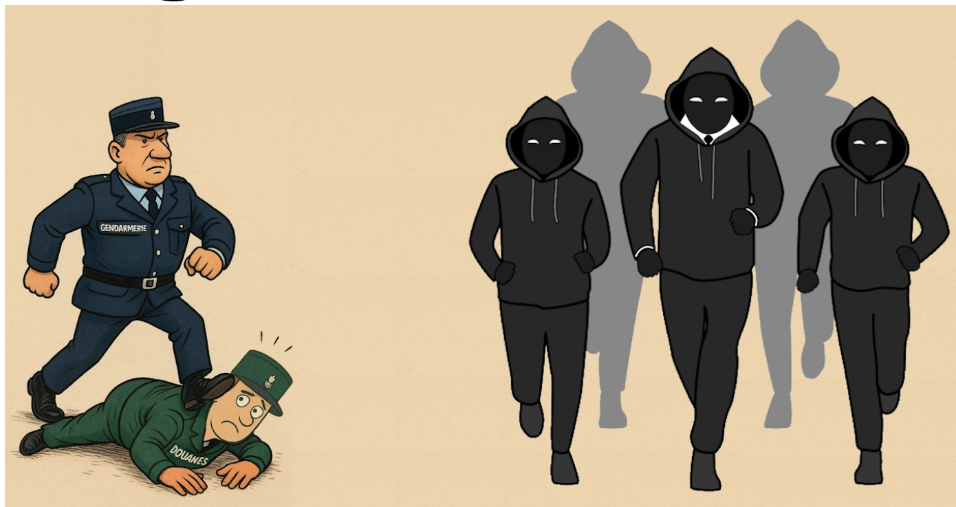
Piétiner face aux trafics ? Les douaniers en deviennent verts !